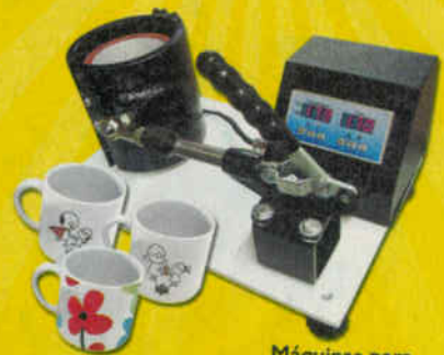
Máquinas para personalizar canecas.

Você estabelece o seu ritmo e faz o seu próprio horário!