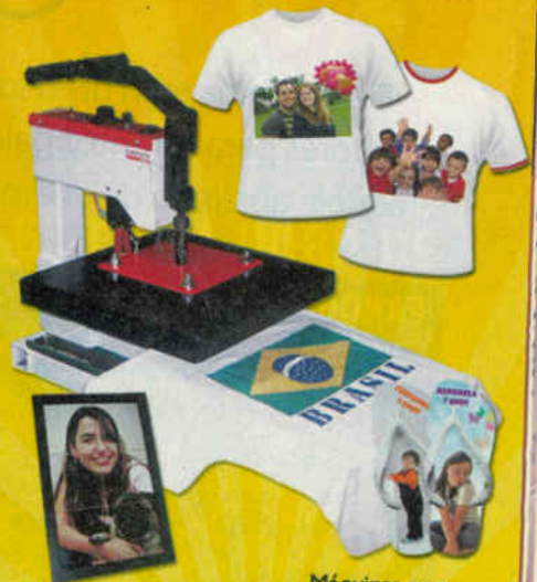
Máquinas para estampar camisetas, chinelos e azulejos.

Fature um dinheiro extra sem sair de casa! Lucre alto vendendo camisetas, sandálias e uma infinidade de produtos personalizados!